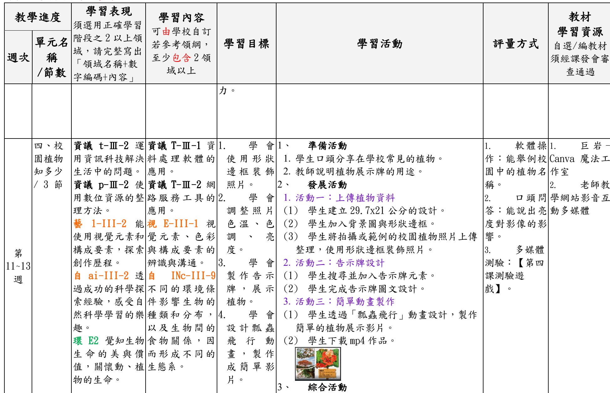
附件 3-3 (國中小各年級適用)