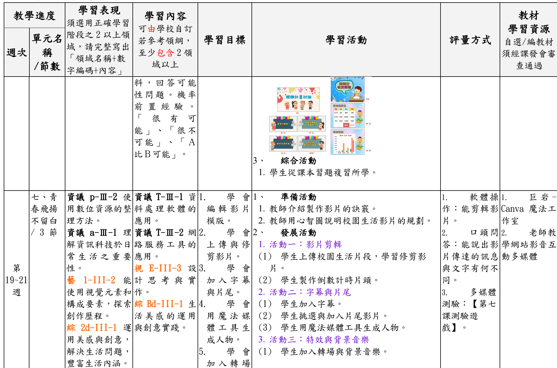
附件 3-3 (國中小各年級適用)